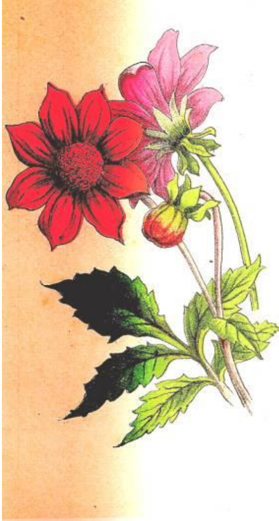
Dahlia coccinea. — Een soort van ENKELE DAHLI